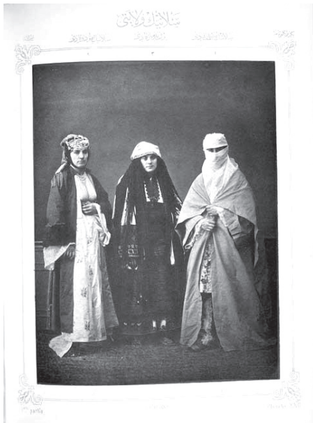
Βουλγάρα, Εβραία, Τουρκάλα